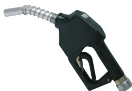
NOZZLE SWITCH CONTROL