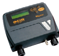
TANK ALARM CONTROL